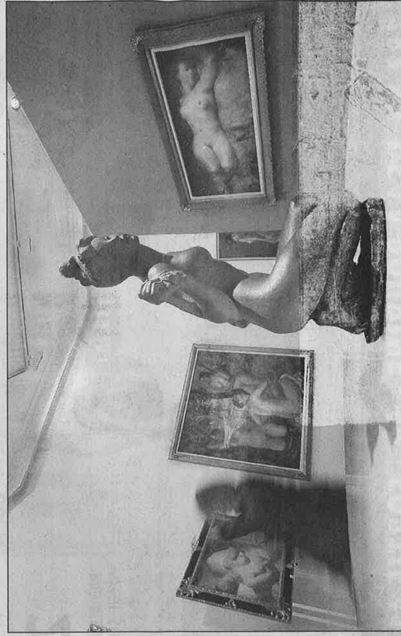
Jusqu'au début de cette année, la Malmaison a exposé 60 chefs-d'œuvre de l'art russe.

On rencontre les vacanciers russes début mai, juste avant le Festival car ils sont en congés et pendant tout le mois d'août. Ce sont des vacanciers riches ou aisés qui logent dans les palaces et hôtels plutôt haut de gamme. Ils aiment le concept des places privées, le glamour, le shopping, le côté chic de Cannes. Mais ce qui les